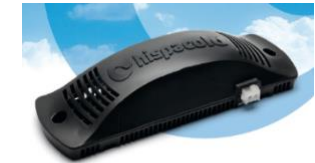
Purificador de aire